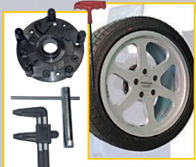
GAR 131H Универсальный фланец Universal flange Universalflansch Plateau universel Flangia universale