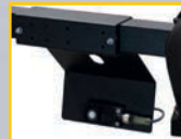
GAR 315 (→ GAR 307)