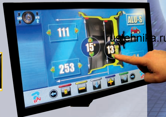
VARGM19TS Сенсорный дисплей (версия)