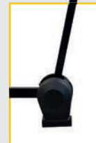
GAR 307 (GP4.140R, G4.140R) Внешняя электронная линейка. External data gauge Breitentaster Calibro larghezza