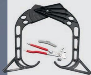
GAR 111 (Ø 44-104 мм)