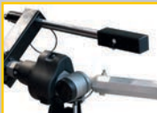
GAR 316 (→ GAR 305) Ультразвуковой датчик для измерения биения колеса. Ultrasound run out sensor Ultraschall-nrundheitsmessvorrichtung Capteur d'excentricité aux ultrasons Sensore eccentricità a ultrasuoni

Digitale Vorrichtung für Vermessung Radbreite-Radunrundheit Détecteur digital pour mesure largeur et faux-rond Dispositivo digitale misura larghezza ed eccentricità