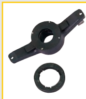
GAR 108 (GP4)