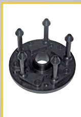
GAR 132 Центровочный фланец Precision flange Typenflansch Plateau de précision Flangia di precisione