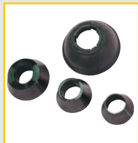
GAR 101 (G4)