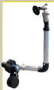
GAR 303 Электронная линейка для измерения ширины колеса и его биения Digital sensor for wheel width and eccentricity measurement

Digitale Vorrichtung für Vermessung Radbreite-Radunrundheit Détecteur digital pour mesure largeur et faux-rond Dispositivo digitale misura larghezza ed eccentricità