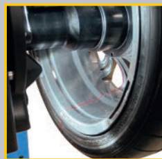
GAR 322 (→ GP4.140R, G4.140R) Лазерный указатель Fixed laser Fixer Laser Laser fixe