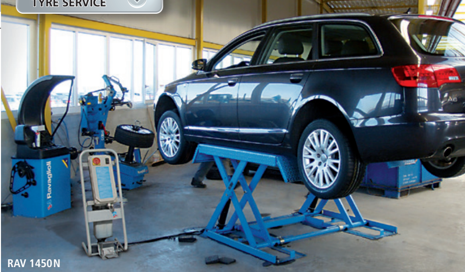
RAV 1450 N