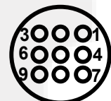
X1 Вид со стороны установки контактов (вилка)