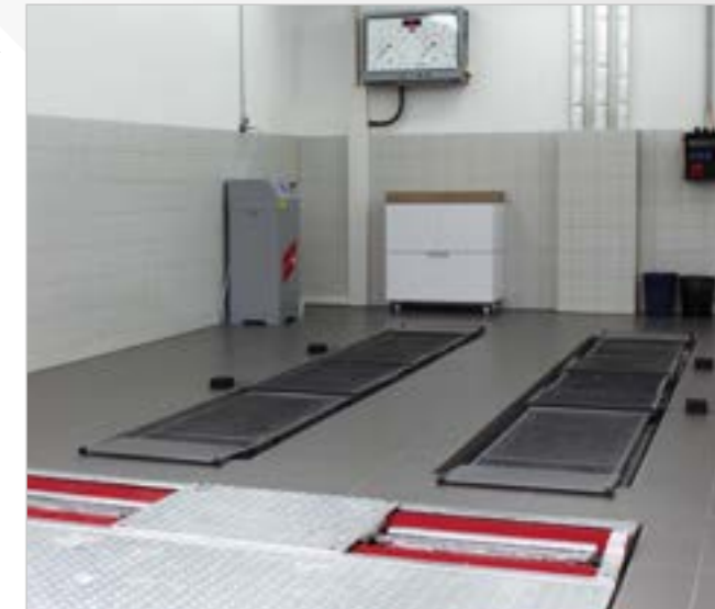
Подключение к ПК (опция)