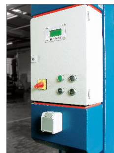
Блок управления HDL 6500 SST