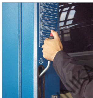
Бесступенчатый рычаг опускания