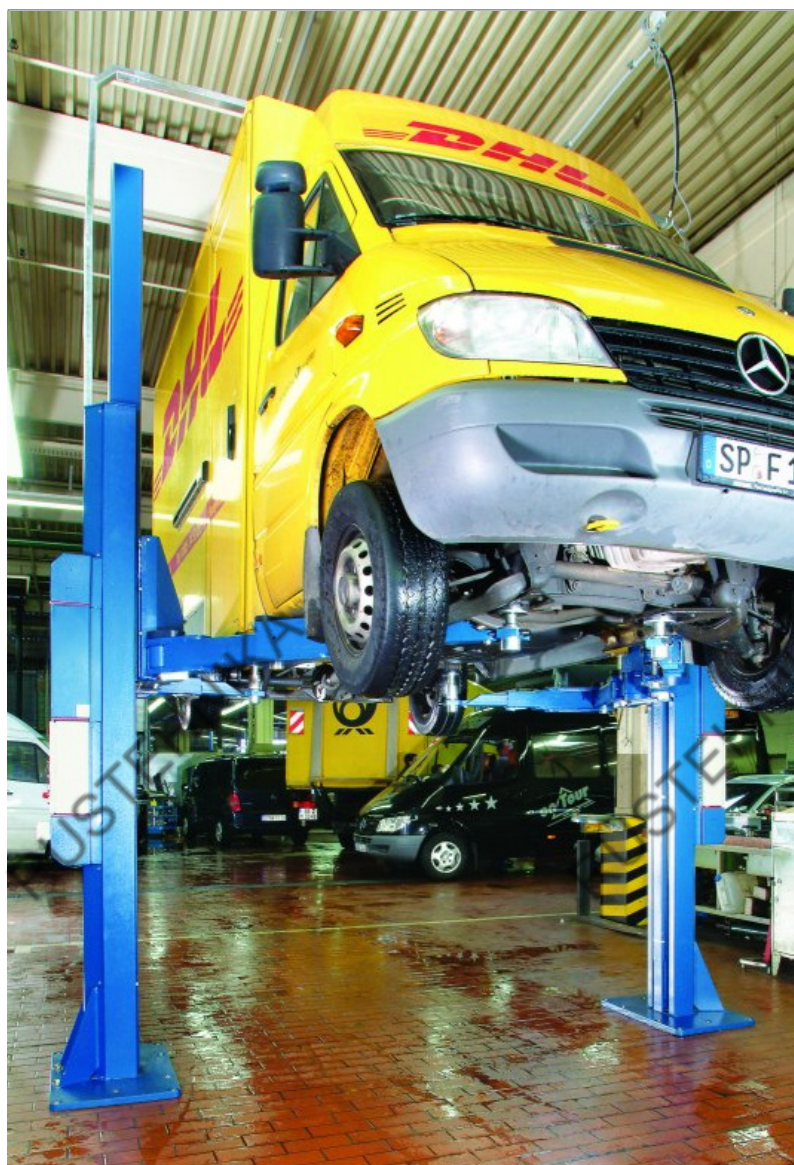
Двухстоечные гидравлические подъемники