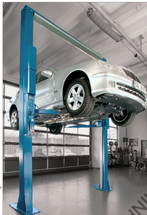
POWER LIFT SPL 4000

Подъемник серии POWER LIFT - гидравлический подъемник, имеет широкий диапазон грузоподъемности: от 3000 до 8000 кг.