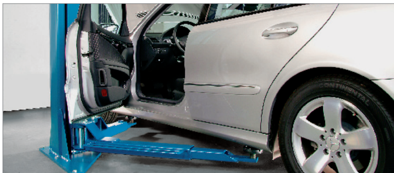
Ассиметричное расположение колонн обеспечивает свободное открывание дверей