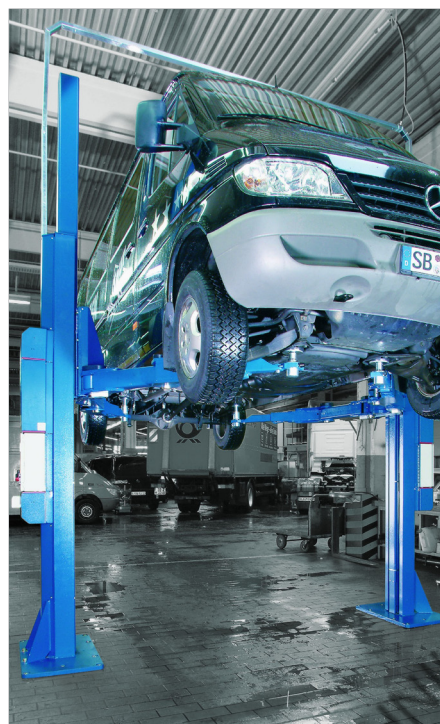
POWER LIFT HDL 6500 SST