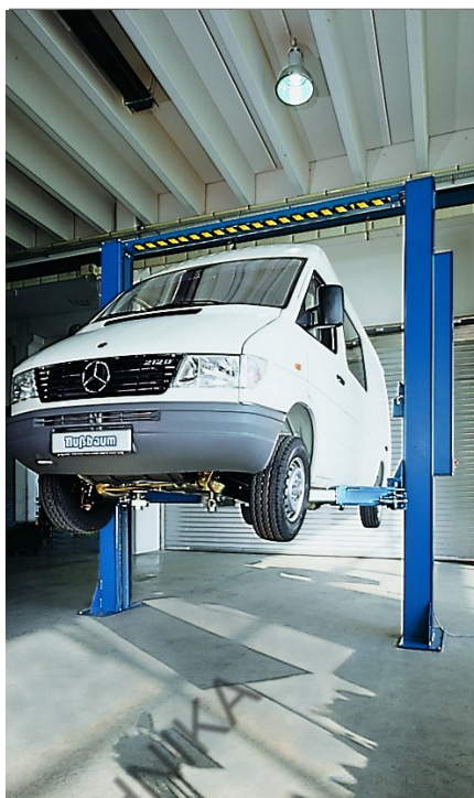
POWER LIFT HDL 5000