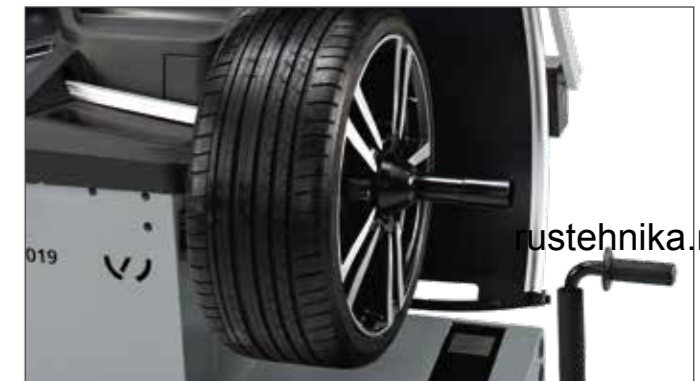
Защитный кожух Патентованный телескопический защитный кожух колеса - дополнительное место сзади стенда не требуется.