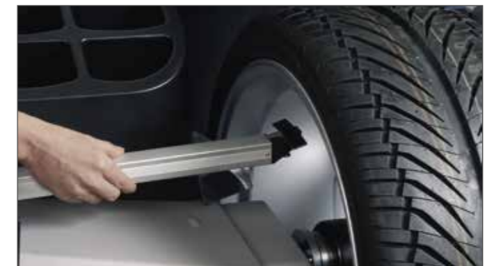
Измерительный рычаг Патентованная технология точного позиционирования клеевых грузов на колесе