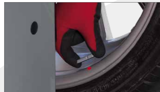
Точный лазерный указатель Быстрое, точное и простое решение позиционирования клеевых грузов на колесе.