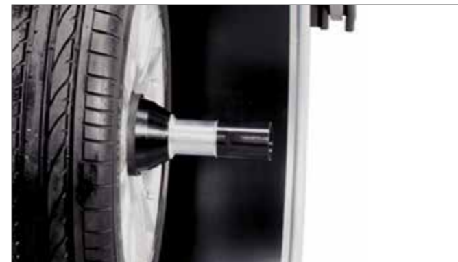
Power Clamp™ Зажимное устройство Power Clamp™: надёжное, быстрое и точное крепление колеса без усилий оператора