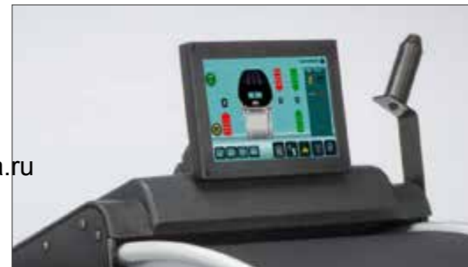
geoTOUCH™: 10" сенсорный дисплей для VAS 741 059, VAS 741 057 и VAS 741 055