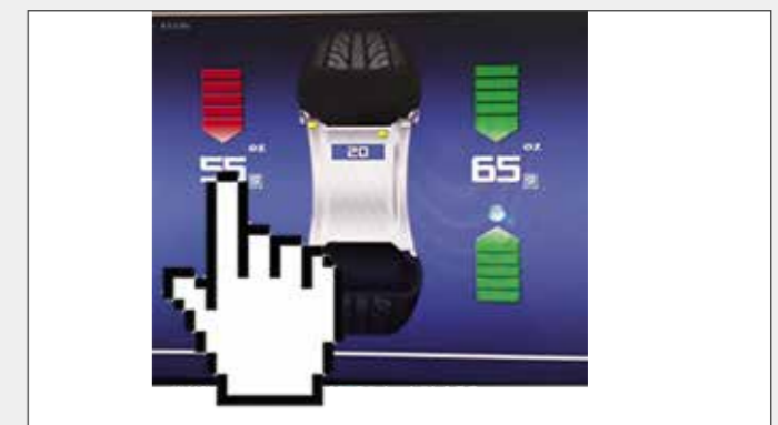
Функция Stop-in-Position Оператору нужно только коснуться указателя массы груза на экране, и колесо автоматически поворачивается в положение уравнивания.