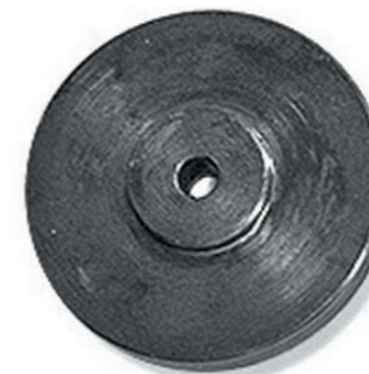
Комплект центрирующих шайб

«Премьеры-Альфа» ..... 22 шт. - 7 600 руб. «Фавориты» ..... 12 шт. - 3 600 руб. «Премьеры» ..... 13 шт. - 4 900 руб.