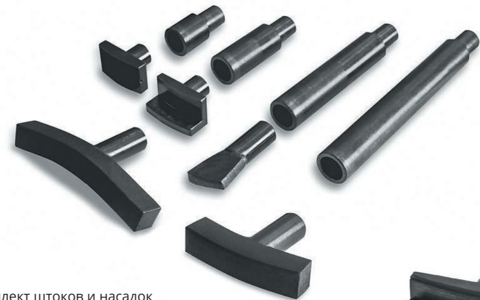
Комплект штоков и насадок