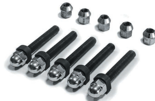
Комплект крепежных болтов и гаек (для всех моделей стандов для правки легкосплавных дисков)