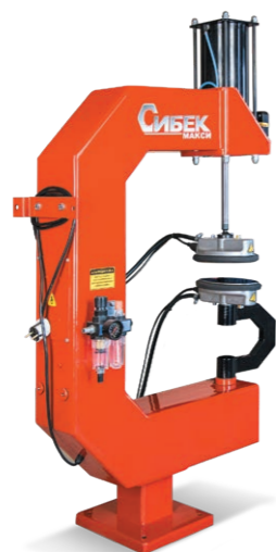
Макси Для ремонта камер и легковых шин до 22 дюймов. 220В, 1230Вт, 150°C