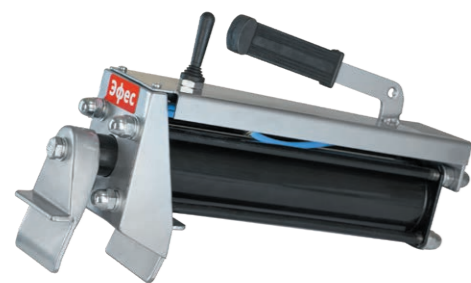
Эфес Пневматический бортрасширитель для шин до 22 дюймов.