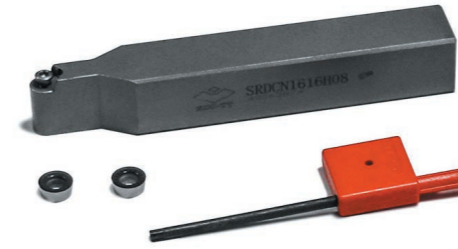
Резец со сменной пластиной («Премьер-Альфа-Т», «Премьер-Альфа-ТР») 7 500 руб.