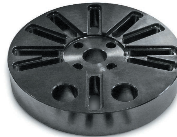
Планшайба для стандов моделей «Фаворит» (-М, -С, -П, -Т), «Премьер Альфа» (-Т, -ТР, -Гидравлик, -Грант)