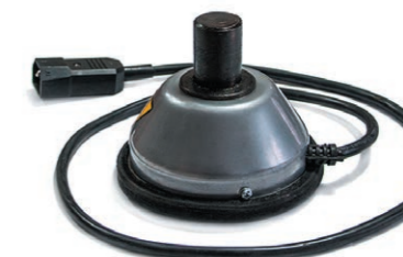
Нагревательный элемент 420 Вт нижний