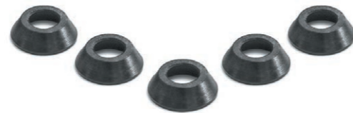
Комплект конусных шайб (для всех моделей стандов для правки легкосплавных дисков)