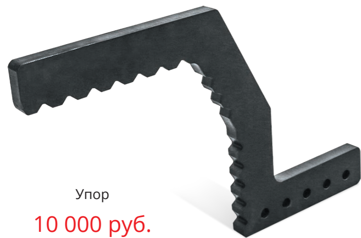
Упор 10 000 руб.