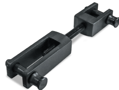
Стяжка («Фаворит-Престиж», «Фаворит-Премиум») 3 000 руб.