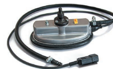
Нагревательный элемент с изменяемой геометрией поверхности верхний