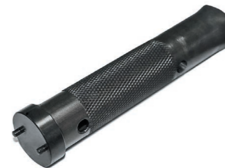
Ключ комбинированный 2 600 руб.