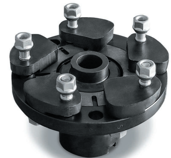
Планшайба для станда «Премьер-Гидравлик»

Дополнительный комплект центрирующих шайб ..... 40 шт. - 14 700 руб.