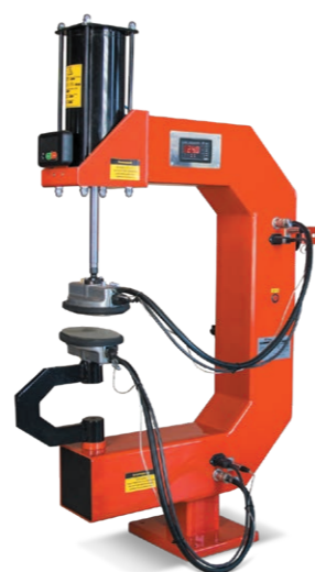
Макси-ТРМ Для ремонта камер и легковых шин до 22 дюймов. 220В, 1230Вт, 150°C