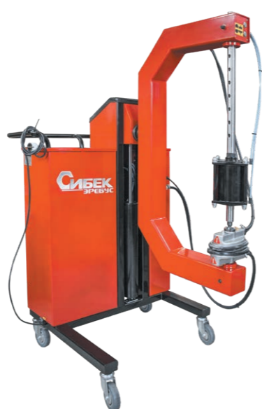
Эребус Для ремонта камер и крупногабаритных шин. 220В, 1230Вт, 150°C