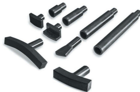
Комплект штоков и насадок