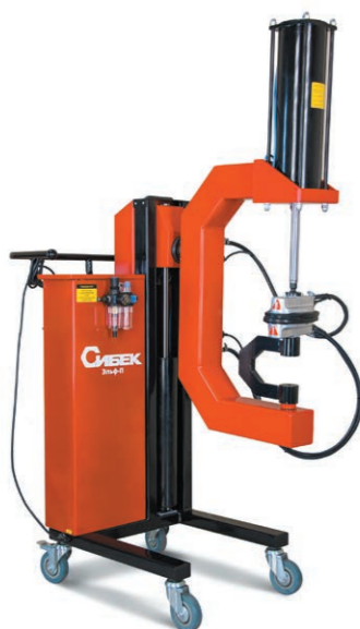
Эльф-П Для ремонта камер и грузовых шин до 22,5 дюймов. 220В, 1220Вт, 150°C