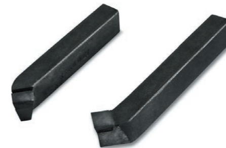
Резцы («Фаворит-Т», «Фаворит-Премиум») 700 руб./шт