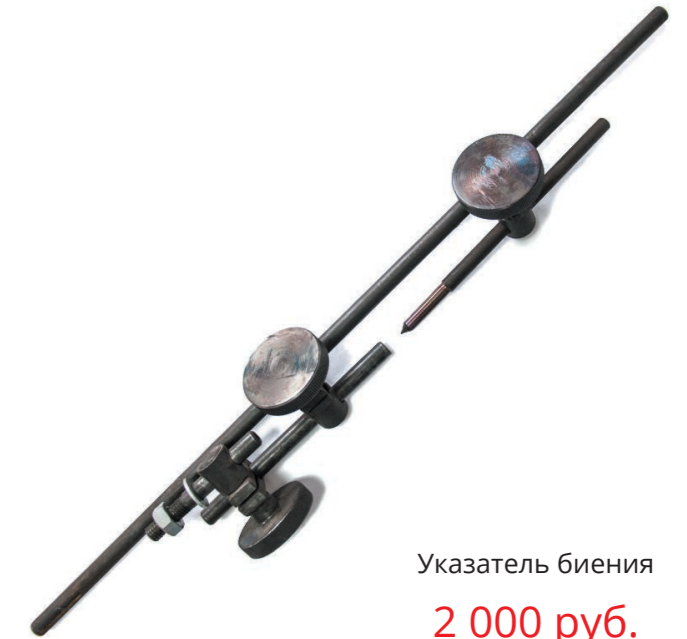
Указатель биения 2 000 руб.