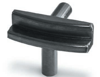
Насадка для правки «восьмерки» литых и кованых дисков