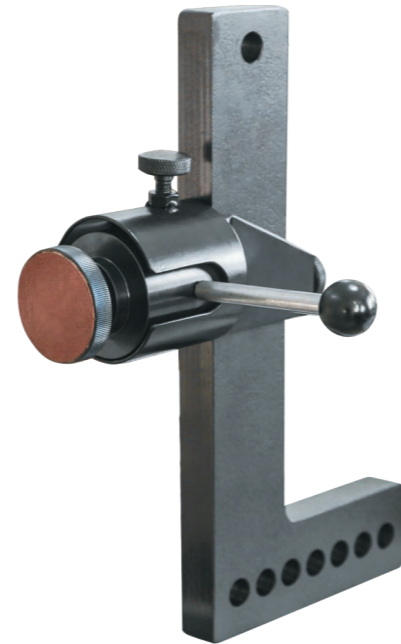
Стойка с передвижным винтовым упором 10 000 руб.