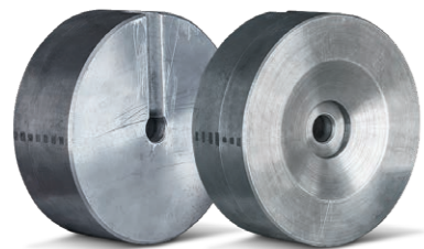
Приспособление для приварки грузовых вентиляй. 220В, 420Вт, 150°C