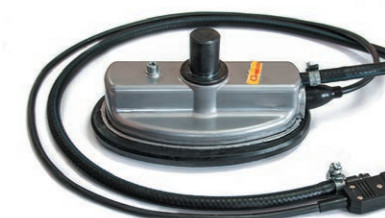
Нагревательный элемент с изменяемой геометрией поверхности нижний