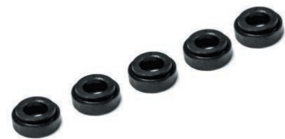
Комплект переходных шайб (для всех моделей стандов для прокатки стальных дисков)