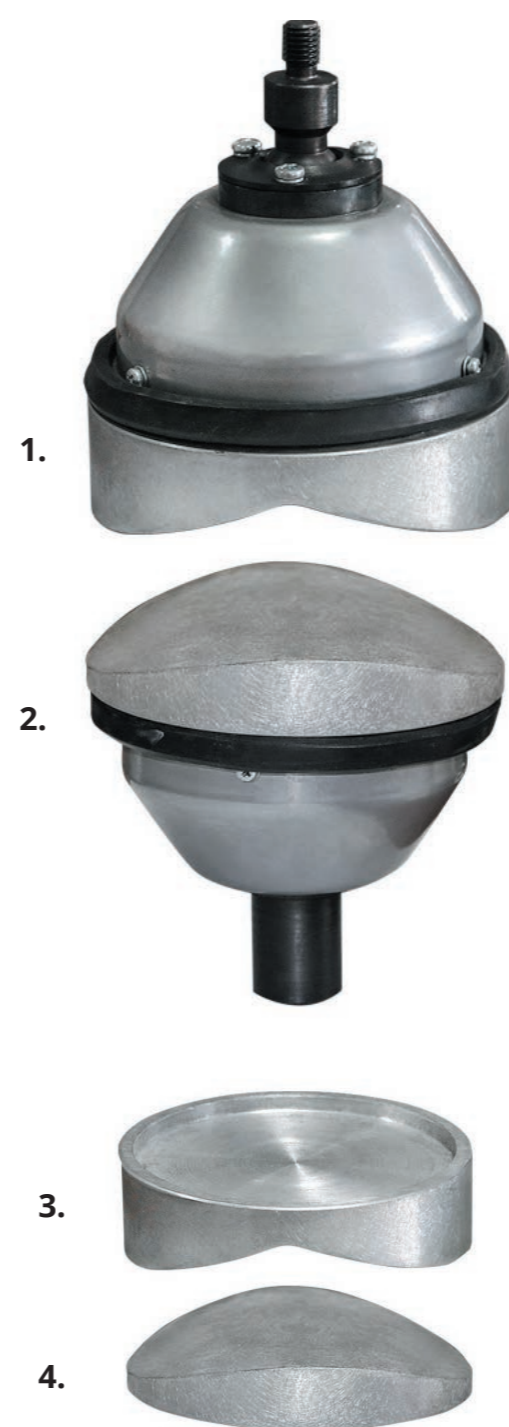
Прижимы и накладки для вулканизаторов «Макси», «Эльф-П» и «Этна-П»