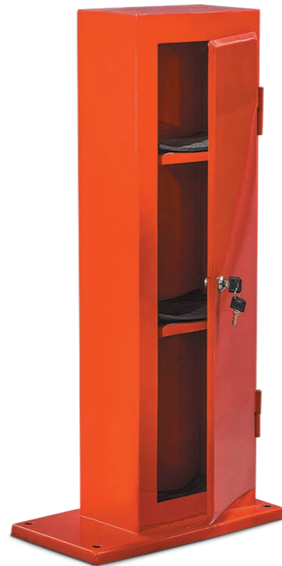
Поддерживающий шкаф для вулканизатора «Этна-П» и бортрасширителя «Стапель-М»