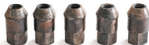
Комплект удлиненных гаек крепления диска (для всех моделей стандов для правки легкосплавных дисков)