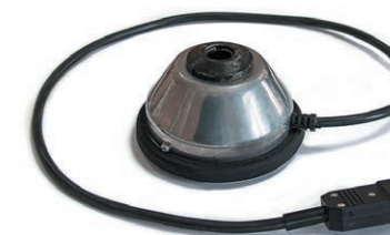
Нагревательный элемент 420 Вт верхний