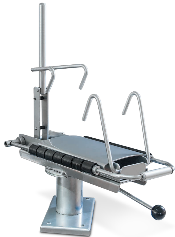
Стапель-М Бортрасширитель комбинированный для ремонта камер и шин 12-19 дюймов.