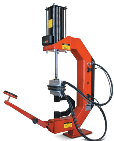
Этна-П Для ремонта камер и легковых шин до 20 дюймов. 220В, 1220Вт, 150°C