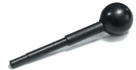
Вороток 600 руб.