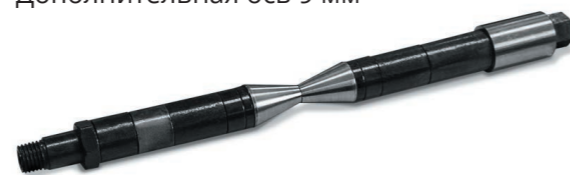
Дополнительная ось 9 мм