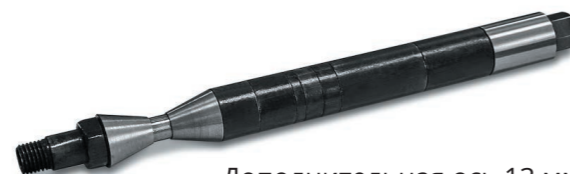
Дополнительная ось 13 мм