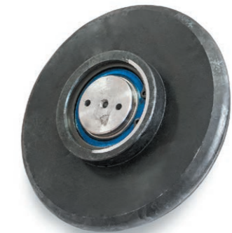
Ролик «Волговский» для станда «Премьер»