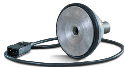
Приспособление для приварки легковых вентиляй. 220В, 420Вт, 150°C