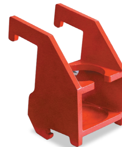
Мобильный кронштейн с боковой и осевой установкой (универсальный)