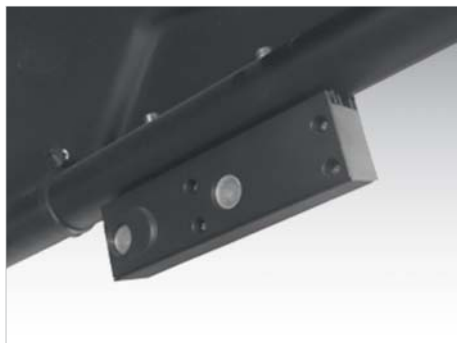
УЗ ДЕТЕКТОР SMART SONAR™