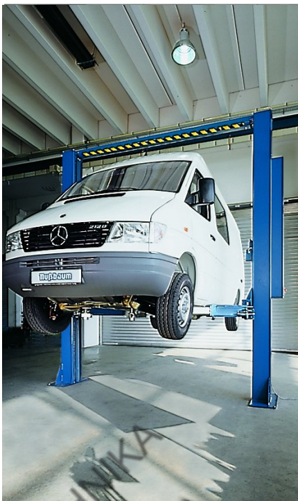
POWER LIFT HDL 5000