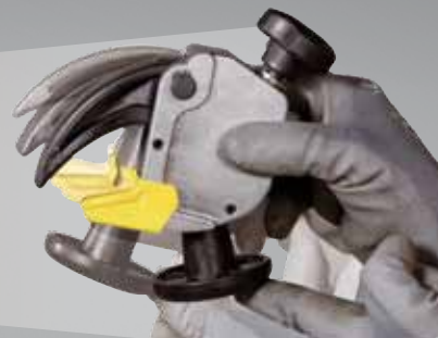
• Con morsetto basculante (accessorio a richiesta) • With mobile clamp (optional accessory)