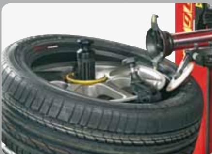
• Con pinza • With clamp