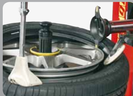
• Con premitallone (accessorio a richiesta) • With bead pressing clamp (optional accessory)