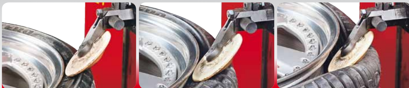
Movimento di stallonatura a penetrazione controllata - Controlled penetration bead breaking movement