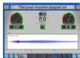
Амортизаторный тест Ясное графическое и цифровое представление измеренной информации.