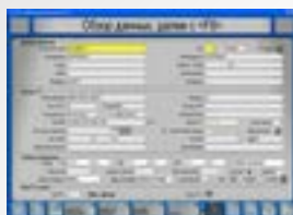
Экран ввода данных Для записи данных по владельцу и автомобилю.