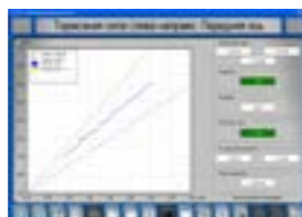
Графики Графическое представление тормозных сил по времени или в зависимости от усилия нажатия на педаль тормоза.