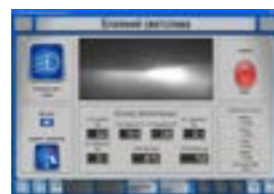
Тест фар Точное определение установки головных фар с помощью CMOS камеры.