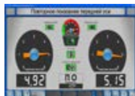
Тест тормозов Цифровое и графическое отображение тормозных сил.