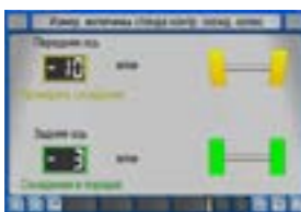
Тестер бокового увода Диагностика состояния осей автомобиля.