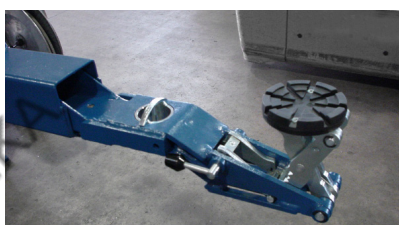
MINI MAX захваты

S-захваты - идеальное позиционирование от короткобазных до длиннобазных автомобилей 3-секционная телескопическая короткая лапа, с диапазоном вылета 480 – 870мм дает большую гибкость при работе с короткобазными автомобилями, как, например, MB и BMW