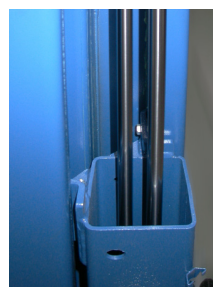
Двойные цилиндры в каждой колонне

Удобное аккуратное управление подъемом и опусканием рычагом